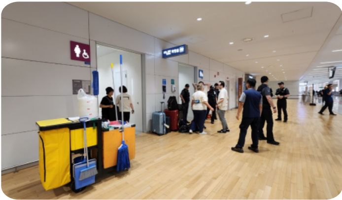
실제 응급상황 발생(8. 11.)

해당 직원은 6월에 사업부에서 진행한 응급처치 교육을 이수한 후, 실제상황에서 탁월한 대처 및 교육 성과를 보여주었습니다. 빠른 판단과 적절한 조치로 공항이용객의 생명을 구한 직원분께 많은 격려를 부탁드립니다.