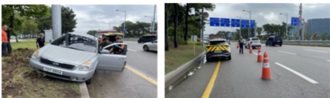
업무 중 맞이할 수 있는 도로 위 사고 상황

하지만 그럼에도 어려움은 있는 법, 순찰업무 중 가장 긴장되는 상황은 공항대로에서의 사고 지원입니다. 빠른 속도로 달리는 차량들 사이에서 사고를 처리하다 보면, 늘 2차 사고 위험이 도사리고 있기 때문입니다.