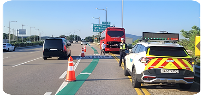
도로에서 근무 중인 조명래 사원

"얼마 전 '인천공항고속도로서 추돌 사고 수습 도중 2차 추돌...2명 사망'이라는 기사를 접했습니다. 사고를 수습 하던 사람들이 2차 사고로 목숨을 잃었다는 사실은 정말 큰 충격이었습니다."