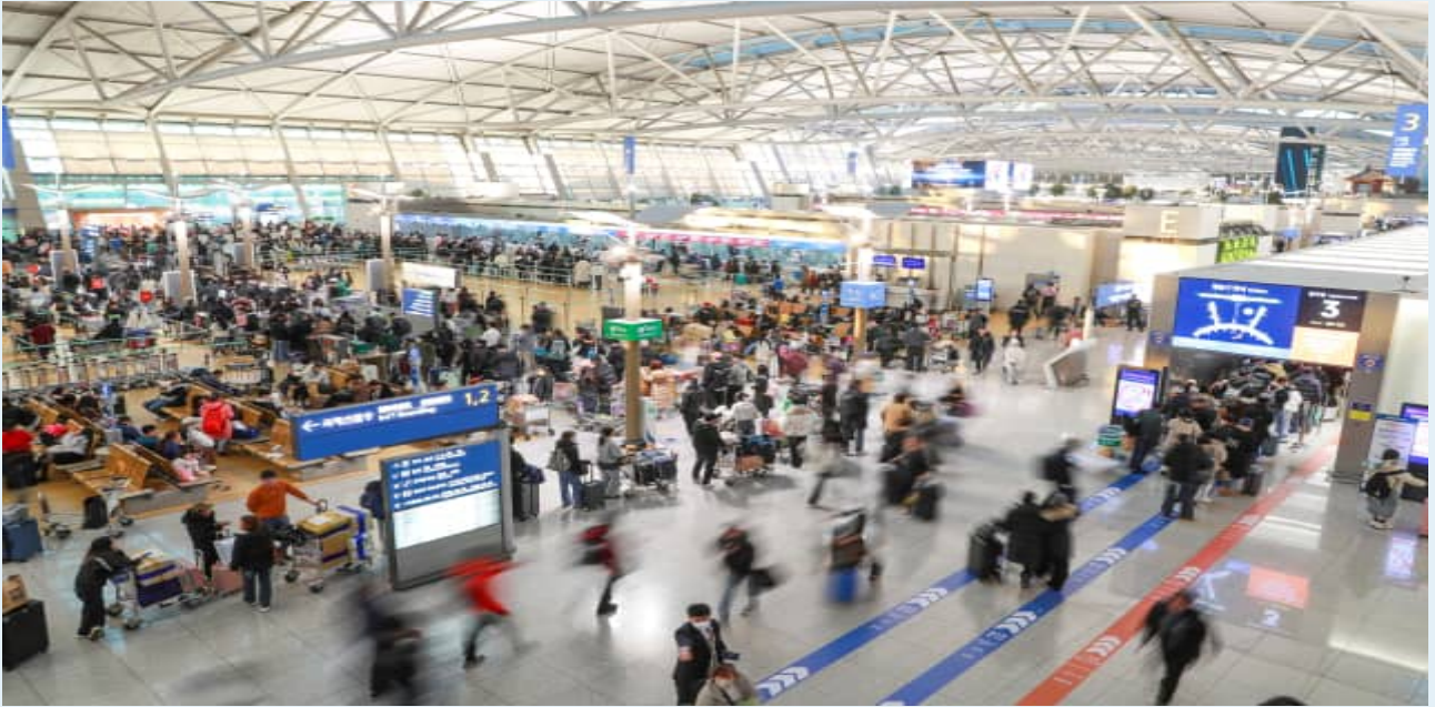
△ 인천국제공항 전경 사진

최근 해외여행 수요 회복과 함께 2025년의 인천공항 여객 이용객수가 역대 최대치인 7,400만명, 운항실적은 42만회를 기록하며 지난 2001년 개항 이후 역대 최대 항공 운송 실적을 달성하였습니다.