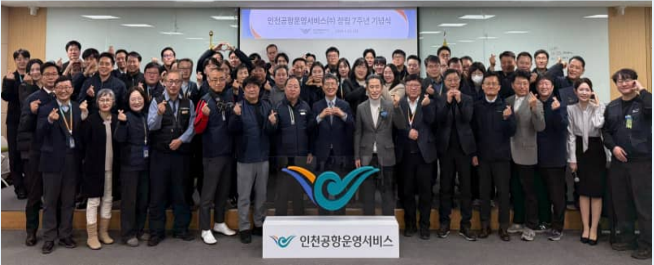
△ 창립기념식 단체 사진

1월 22일, 회사 창립 7주년을 맞아 창립 기념식이 개최되었습니다. 이번 기념식은 지난 7년간 회사가 걸어온 발자취를 되돌아보고, 앞으로의 도약을 다짐하는 뜻깊은 자리로 마련되었습니다. 행사에는 경영진을 비롯해 노동조합 대표, 직원 등 약 100여 명이 참석해 자리를 빛내주셨으며, 회사의 성장과 발전을 함께 축하하는 시간을 가졌습니다.