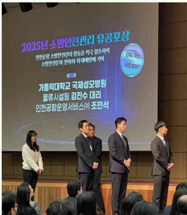
△ 2025년 소방안전관리 유공 포상(오른쪽 2번째)

1월 5일, 공사에서 인천국제공항 소방안전관리 유공자를 대상으로 포상을 수여하였습니다.